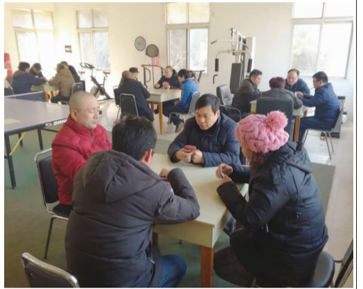
春节前夕,江海分公司工会紧贴职工精神文化需求,利用生产间隙组织开展了象棋、乒乓球、台球、掼蛋等系列文体活动。通过活动的开展,进一步丰富了职工的业余文化生活,凝聚了人心,鼓舞了士气,为欢度祥和喜庆的新春佳节营造了浓郁的节日氛围。