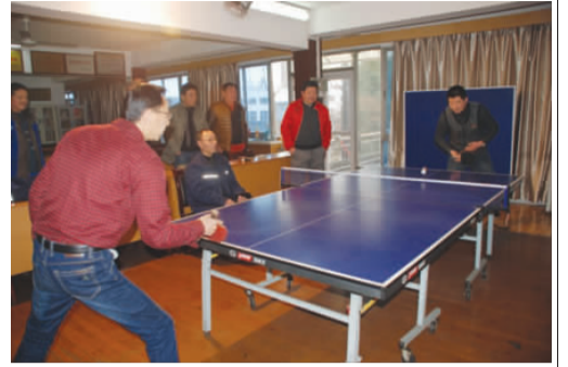
春节前夕,为丰富和活跃职工文体生活,展现公司干部职工团结、和谐、健康、向上的精神风貌,营造新春喜庆祥和氛围,通州分公司工会举办了迎新文体活动,100多名职工踊跃参加。