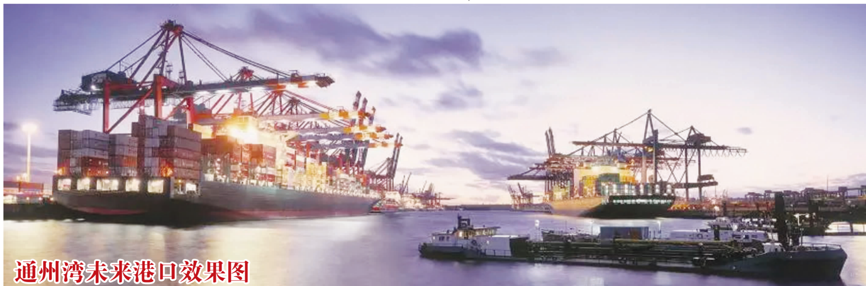
通州湾未来港口效果图

四、增强进取意识,助力通州湾开发。 通州湾建设是南通市以港口转型推动产业转型、城市转型的重要战略,也是江苏省港口重大发展战略部署。李克强总理提出,要把通州湾建设成为长江经济带战略支点,又将通州湾的建设提升为国家和省级战略层面。这是摆在我们南通港人面前的一次重要机遇。现在通海港区至通州湾港区铁路专用线一期工程大型临建被列为2019年江苏省交通建设重点工程项目,工期紧、任务重。省市将重新部署,调整机构设置,增强力量,加大推进力度。但是不管形势任务如何变化,作为南通港口建设大军的一员,我们依然要发扬老一辈南通港人“敢为人先、开拓进取、攻坚克难”的作风,助力建设投资公司,做好通州湾海港建设、疏港铁路专用线工程开发建设,确保圆满完成年度目标任务。