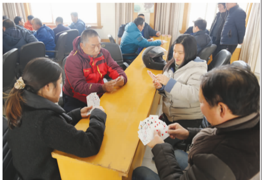
为丰富职工的文化娱乐生活,提高企业的凝聚力,狼山港务分公司工会利用工余时间,于1月23日在六楼会议室组织开展了职工迎新春“掼蛋”比赛活动。来自各部门的64名职工参加了比赛。图为“掼蛋”比赛活动图片。